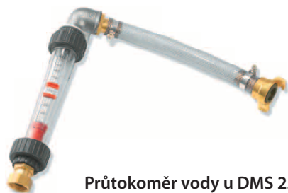
Průtokoměr vody u DMS 25