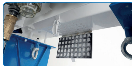
Díky čistící klapce je možné zařízení snadno a rychle vyčistit.