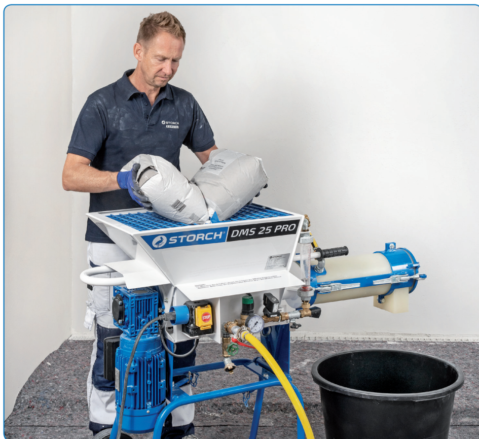
Ochranná mřížka s hroty pro snadné roztržení obalu a rychlé vyprázdnění obsahu pytle.