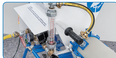
Ukazatel průtoku vody.